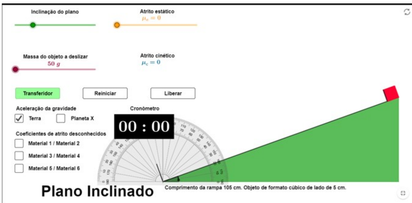
Figura 3. Tela inicial da simulação.

Na Figura 3 temos a tela inicial da simulação Plano Inclinado após ajustar a inclinação para 20^\circ , pressionar o botão Transferidor e ampliar a imagem (utilizando o scroll do mouse). A rampa a ser considerada na simulação possui 105 cm de comprimento e o bloco que irá deslizar sobre ela tem a forma cúbica com 5,0 cm de aresta, permitindo um deslocamento total de 100 cm.